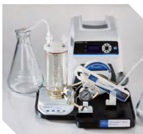
Minimate EVO切向流超滤系统 25mL-1L