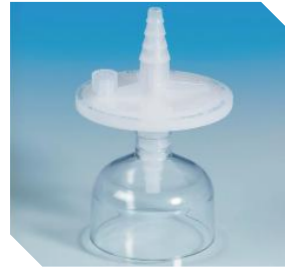
AcroPak® 20 <2 L