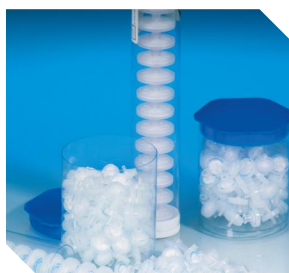
针头过滤器和圆盘过滤膜片

<500 \mu L Nanosep MF过滤器 <2mL 4mm针头过滤器 <10mL 13mm针头过滤器 <125mL 25mm针头过滤器