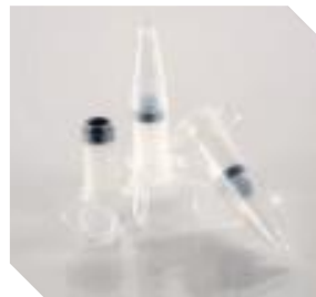
Nanosep系列 处理体积范围: 50 μL - 500 μL (3Kd-300Kd)