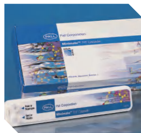
Minimate EVO切向流膜包 1Kd-1000Kd