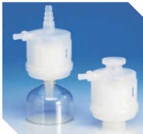
AcroPak 200 <20 L