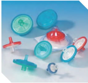
Acrodisc® <150 mL