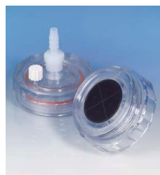
聚碳酸酯在线滤器