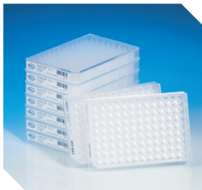
AcroPrep Advance滤板 高通量产品优选 96孔板 24孔板