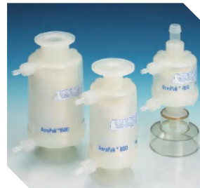
AcroPak 1000 <100 L