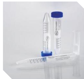
Microsep Advance系列 处理体积范围: 500 μL - 5 mL (1Kd-100Kd)