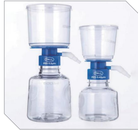
AcroVac ≤1 L