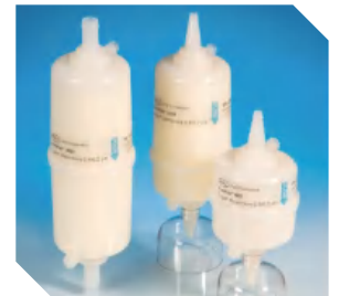
AcroPak 1500 <150 L

根据过滤体积需求进行相应型号匹配,不同型号孔径不同(膜材、孔径、处理体积、样本)