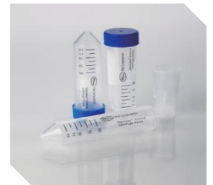
Macrosep Advance系列 处理体积范围: 3.5 ml - 20 ml (1Kd-100Kd)