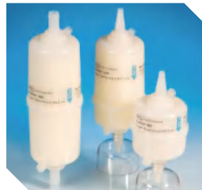
AcroPak 500 <50 L